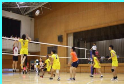
7年連続関東大会出場 都大会ベスト8