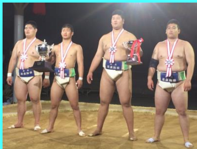
平成29年度 インターハイ団体第3位 高等学校相撲金沢大会団体準優勝 個人優勝・準優勝 全国選抜十和田大会団体準優勝

85%の生徒が部活動に参加しています。部活動を通して帰属意識を高め愛校心を育てるとともに、社会生活のルールを学びます。また健全な生活習慣の確立を通して、自己管理の意識を高めます。平成30年度から「相撲部」「男子バレーボール部」が、継続してスポーツ特別強化校として、3年間の指定を受けました。