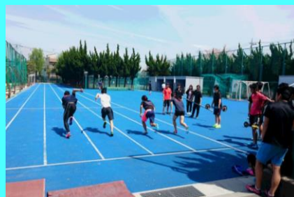
6年連続 関東大会 関東選抜大会出場