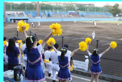
平成30年度 秋季東京都高等学校野球大会 ベスト16